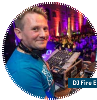
DJ Fire Entertainment

ab 22.30 Uhr Aftershow-Party mit DJ FIRE ENTERTAINMENT