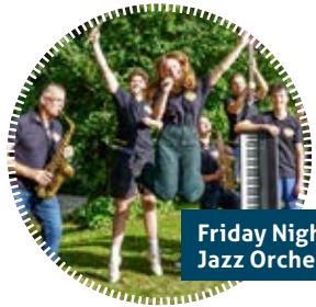
Friday Night Jazz Orchestra